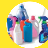
FLACONS DE PRODUITS MÉNAGERS EN PLASTIQUE

> Les emballages/papiers doivent être déposés en vrac dans le bac ( pas de sac )