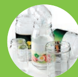
BOCAUX EN VERRE