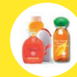
FLACONS DE PRODUITS D'HYGIÈNE EN PLASTIQUE