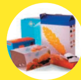
BOÎTES ET SUREMBALLAGES EN CARTON