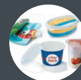
EMBALLAGES PRODUITS LAITIERS