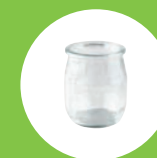
POTS EN VERRE

Consultez la liste des emplacements sur le site du syndicat : smirtomduvexin.net