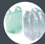
FILMS ET SACS EN PLASTIQUE