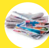
PAPIERS, JOURNAUX, MAGAZINES