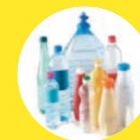
BOUTEILLES EN PLASTIQUE